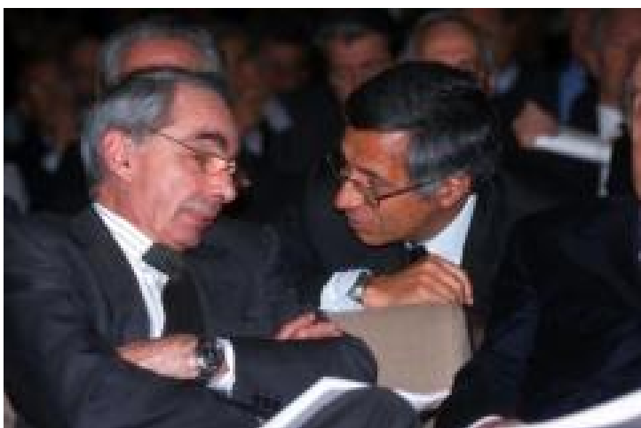
bassanini - amato

Due amici, due professori universitari che inframezzano l'attività accademica a frequenti incursioni politiche e istituzionali, due socialisti anomali approdati successivamente in area Pd con relazioni a tutto tondo, due uomini di potere inscalfibile, intelligenti, con la passione per Siena e la Toscana.